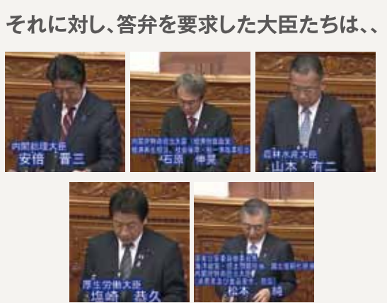
それに対し、答弁を要求した大臣たちは、... 官僚が準備した機械的な答弁に終始し、議論は深まらず